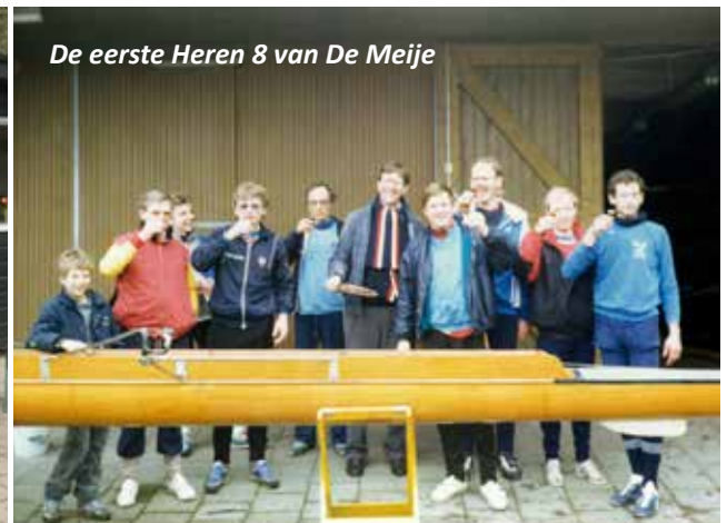
De eerste Heren 8 van De Meije