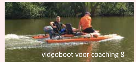
videoboot voor coaching 8

Er is een grote behoefte aan coachcursussen. Ze worden zowel door de KNRB als door RowAnalysis gegeven en hebben ook beide een inhouse-variant. De voor- en nadelen worden op een rijtje gezet zodat we de voor de vereniging beste optie kunnen kiezen. Overigens heeft RowAnalysis een roeiapp ontwikkeld die nu al te downloaden is en boordevol informatie staat. Ga hiervoor naar www.roeiapp.nl